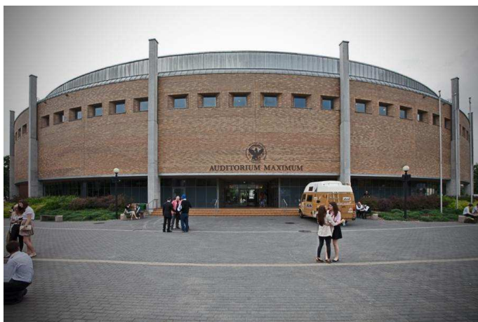
Auditorium Maximum UKSW, budynek 21